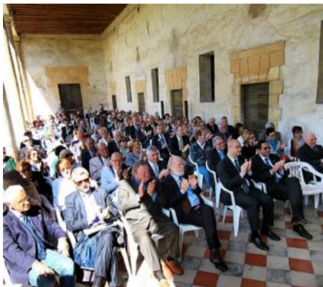
Il pubblico alla consegna del premio "Benetazzo".