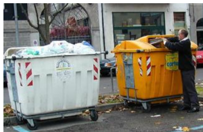
Il Consiglio ha fissato la rateazione per l'imposta sui rifiuti. ARCHIVIO

Il versamento dovrà essere fatto in giugno, settembre e dicembre