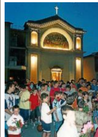
Una festa al S. Gaetano.

Patronato in festa oggi per la giornata dedicata alla grande "Famiglia del Murialdo".